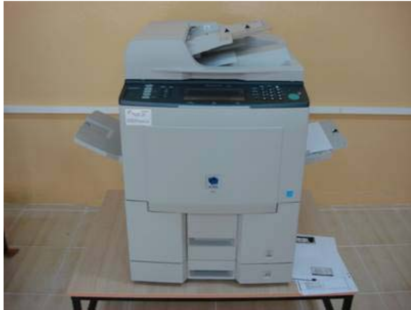
Panasonic DP 8035 Fotokopi Makinası

Tez ve proje raporları gibi kaliteli çıktı ihtiyacı duyulan dökümanların (cihazı yazıcı olarak veya fotokopi olarak kullanmak suretiyle) çoğaltılmasında kullanılmaktadır.