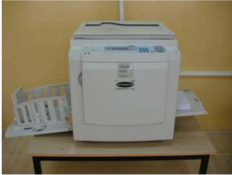
Gestetner DX3440 Baskı Makinası

Baskı makinası siyah/beyaz olup bölümlerimizin sınav sorularının çoğaltılmasında kullanılmaktadır. Kullandığı master kağıt ve mürekkep dikkate alındığında en az 50 adet baskı yapıldığında avantajlı olmaktadır.