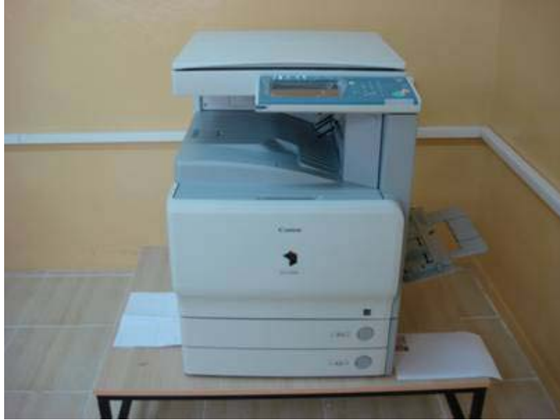
Canon IRC3380i Renkli Fotokopi Makinası

Tez ve proje raporları gibi kaliteli çıktı ihtiyacı duyulan renkli dökümanların (cihazı yazıcı olarak veya fotokopi olarak kullanmak suretiyle) çoğaltılmasında kullanılmaktadır.