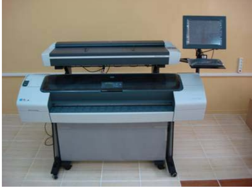
HP Designjet T1100ps Plotter ve T1100MFP Scanner

Ulusal ve uluslararası projelerde kullanılacak poster, afiş ve benzeri dökümanları kaliteli ve renkli olarak çıktı vermede kullanılmaktadır. Mat rulo ve parlak fotoğraf rulo kağıtlarımız mevcut olup dökümanlar orantılı olarak isteğe göre büyütülüp küçültülebilmektedir. Scanner'dan taranan doküman direk plotter'dan çıktı alınabilmektedir.